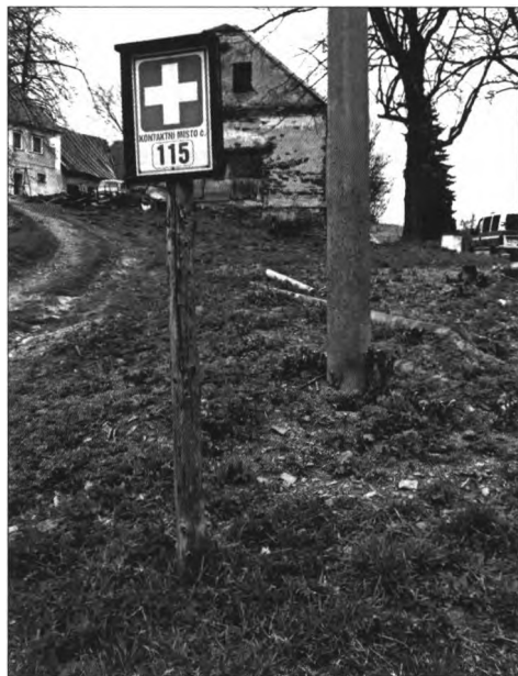
Obr. 22. Norberčany. Místo, na kterém stál památník padlých v první světové válce, 2011.