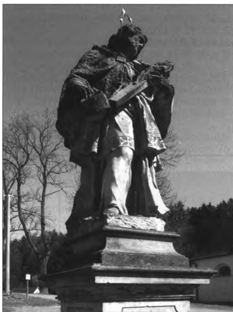
Obr. 21. Norberčany. Socha sv. Jana Nepomuckého, 2011.

1. Pískovcová socha sv. Jana Nepomuckého, stojící vlevo od kostela, byla pořízena obcí v roce 1754, v jejím majetku také dodnes zůstala. Autora ani datum svěcení zatím neznáme. Na obdélném soklu stojí profilovaný hranolový dřík zdobený ve spodní části po všech stranách akantem (nad ním byla umístěna kovová lampička), na čelní stěně vytesán letopočet 1751(!)–1925. 83 Dřík je ukončený masivní profilovanou přesahující římsou, nad kterou přechází v nižší podstavec se sochou stojícího světce v tradičním oděvu, držícího v levé ruce kříž s korpusem Ukřižovaného Krista a v pravé bilet. Vzhledem k vynikající úrovni sochařského zpracování byla socha v roce 1963 zapsána do seznamu nemovitých kulturních památek. V roce 1966 bylo zjištěno uražení části ramene a kříže, zvětrávání kamene a také stopy olejových nátěrů. Památková revize upozornila majitele v roce 1973 na to, že místo kolem sochy je nutné upravit. Pískovec byl porostlý mechem a v bezprostřední blízkosti sochy byla hromada kamení. Další četná mechanická poškození, uvolněná svatozár a zvětraný pískovec byly zjištěny k roku