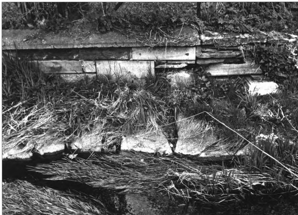
Obr. 23. Norberčany. Fragменты kamenného kříže použité na zídku nad potokem, 2011.

do navršených oblých kamenů. V jeho těsné blízkosti byla květinová úprava a symbolické(?) hroby, vše bylo od vnějšku odděleno nízkým bílým laťovým plotem. O osudu této památky již není nic známo(!) Místo poznáme podle dřevěného sloupku s nápisem Kontaktní místo č. 115 .